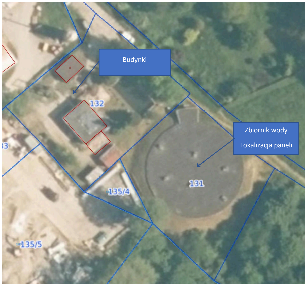
Rysunek 1.1 Lokalizacja działki nr 131, 132 –Czatkowice.