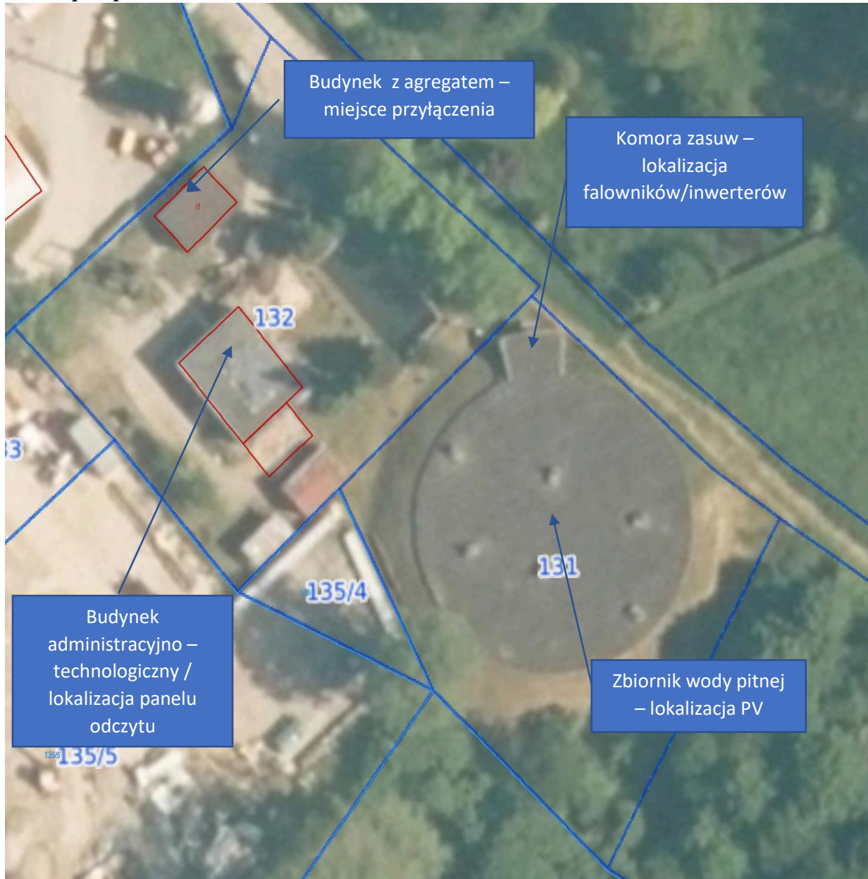
Rys.1.2 Usytuowanie poszczególnych obiektów